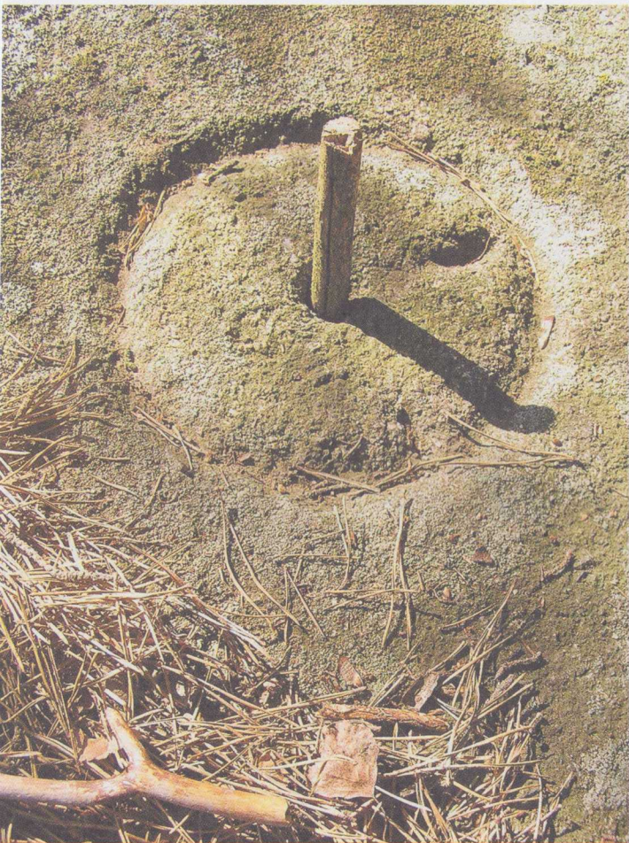
SLUNEČNÍ HODINY STARÝCH KAMENÍKŮ NEDALEKO KAMENNÉ