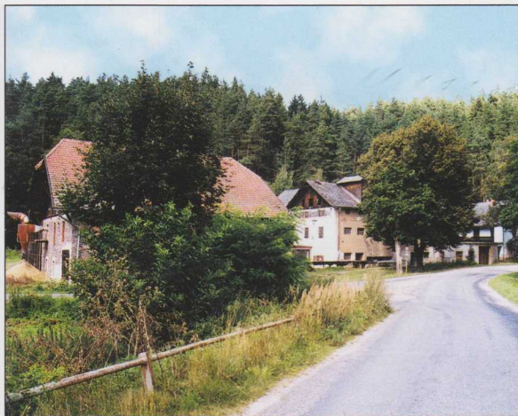
43. Panský mlýn - Papírna