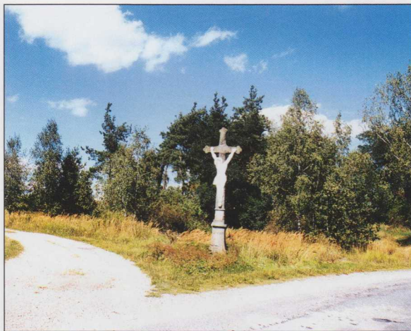
44. Kříž na cestě mezi Kamennou a tasovskou Papírnou