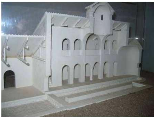
Pravděpodobná podoba velkomoravské trojlodní baziliky v Mikulčicích

Tím vůdcem se měl stát Metoděj. Navzdory nezpochybnitelnému diplomatickému úspěchu, nebyla Metodějova pozice snadná. Podstata rozhodnutí papeže byla sice ve schválení slovanských bohoslužebných textů i veškerého učení Konstantina a Metoděje, současně ale nařizovala navrácení latinských kněží. Právě tento bod si latiníci vysvětlili po svém a politické vítězství soluňských bratrů pojali jako vítězství své. Metoděj byl při návratu na Moravu dokonce přepaden a zajat. Iniciátorem tohoto skutku byl právě latinský klérus, který se odmítal dělit o církevní sféru vlivu. Pod taktovkou východofranského krále Ludvíka II. Němce byl pak Metoděj souzen, odsouzen na doživotí a uvězněn. Na Moravě mezitím došlo k převratu. Napětí mezi Rastislavem a jeho synovcem Svatoplukem, jenž se již nějakou dobu podílel na vládě, překročilo únosnou mez. Jeden druhého se snažil odstranit. Úspěšnější byl Svatopluk, který knížete Rastislava zajal a vydal do nepřátelských rukou východofranského krále Ludvíka II. Němce.