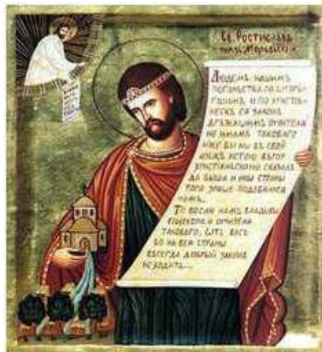
Moravský kníže Rastislav v idylickém zobrazení pravoslavné církve.

Michal III. 6 a cařihradský patriarcha Fotios byli mnohem prozíravější. Uvědomili si, že v konfliktu s Bulharskem mohou mít na své straně mocného spojence a stejnou roli by pak Morava mohla hrát ve sporech s Římem. Fotios, jako vrchní diplomat byzantské říše, se rozhodl Rastislavově žádosti vyhovět. Potřeboval jen osobnost, která v napůl barbarském prostředí dokáže stabilně prosadit křesťanství a současně zaváže Moravu k partnerství. Snad nikdo se pro daný úkol v danou dobu nehodil lépe než Konstantin. Jako pomocníka si Konstantin vybral staršího bratra Metoděje. Oba vyrostli ve slovanském prostředí, znali mentalitu Slovanů a oba měli s tímto etnikem bohaté zkušenosti. Spojení Konstantinova intelektu a Metodějových organizačních a diplomatických dispozic pak dávaly misii reálnou vidinu úspěchu. Ještě než se vypravili věrozvěstové na cestu, vypracoval Konstantin s vypětím všech sil 7 písmo (tzv. hlaholici), které mělo výstižně vyjadřovat specifika slovanského jazyka a stát se tak písmem slovanských národů. Svěřený úkol zvládl dokonale.