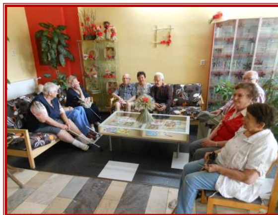
Návštěva knihovny na Modřínové ul.

Souhlasíte s námi, že společná písnička udělá dobrou náladu? Přijďte mezi nás. A jak se v Domovince žije, vám napoví písnička DO-MO-VINKA, DOMOVINKA (na melodii Já už jdu, už mám všechno hotový)